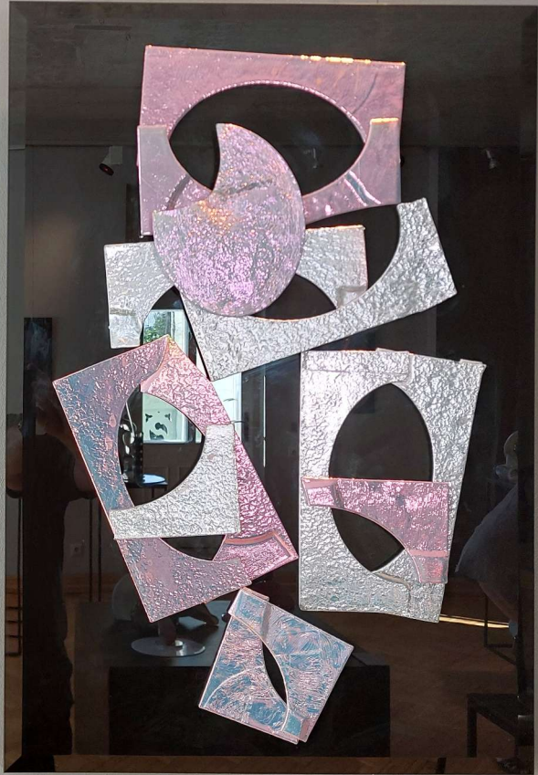
Das Titel Gef Wit Wit