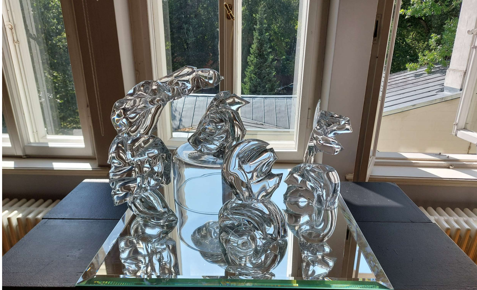
Dainis GUDOVSKIS Les Gymnopées, Été 2016 Les Gymnopées, Zim 2016